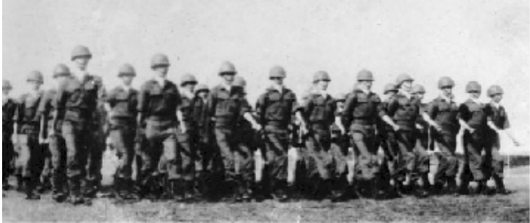
TKS tham dự diễn hành tại Vũ Đình Trường Lê Lợi trong buổi lễ Khai Mạc Mùa Quân Sự.