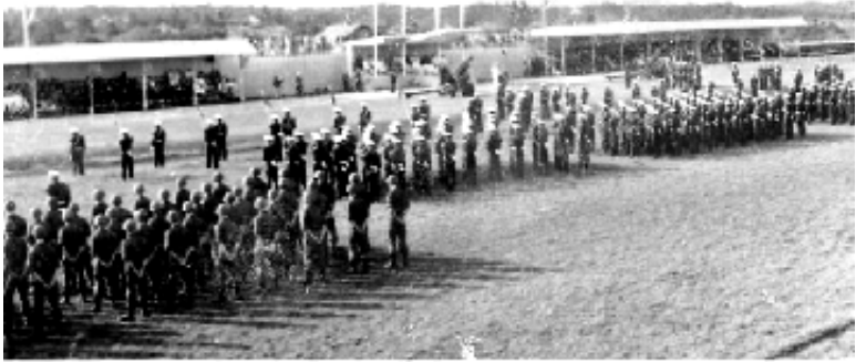
Khai mạc Mùa Quân Sự, TKS chỉnh tề trong bộ tác chiến, mũ lưỡi trai, giày MAP, đứng thành hai khối trên Vũ đình trường