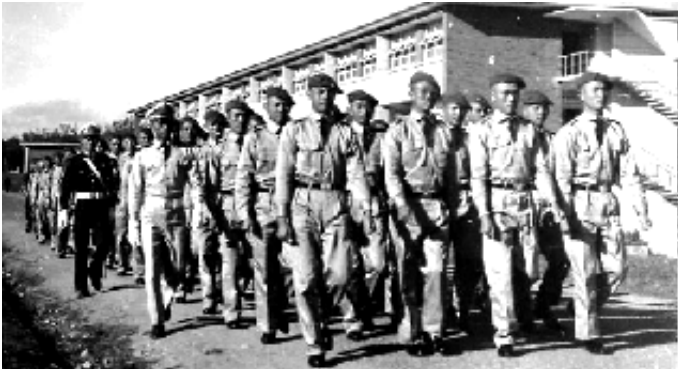
trên đường từ doanh trại đến các lớp học