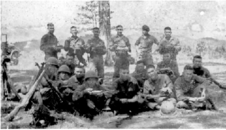
Những giây phút thoải mái ngoài bãi tập trong giờ ăn