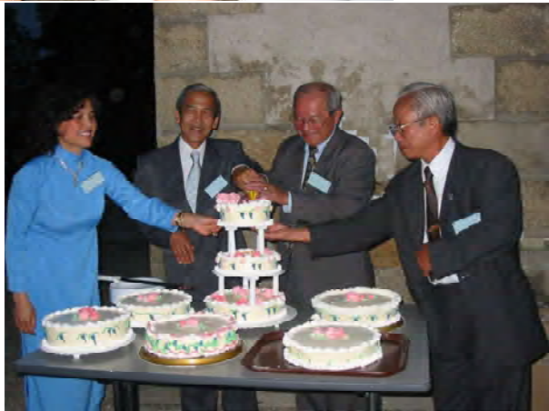
Cắt bánh kỷ niệm